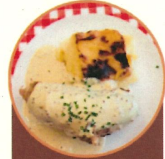
Andouillette Gratin dauphinois